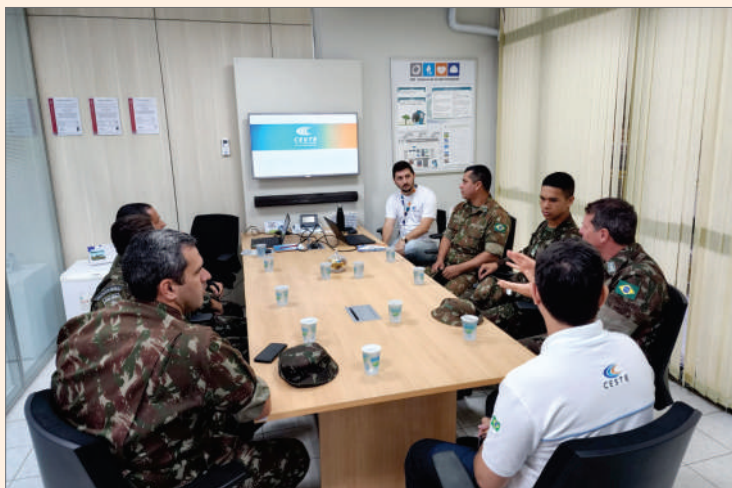
Visita do 50º Batalhão de Infantaria de Selva trata da importância da segurança patrimonial

Cumprir as leis é uma responsabilidade, e todos devem caminhar juntos para manter a segurança nas áreas de pesca.