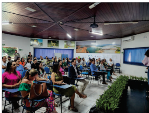
Palestra sobre violência contra mulher conscientiza colaboradores da UHE Estreito e a comunidade

Buscamos atuar com uma visão de futuro, comprometidos em contribuir para o desenvolvimento social de forma sustentável, preservando o meio ambiente para as gerações presentes e futuras. Entendemos que a responsabilidade social e ambiental são pilares fundamentais para o sucesso das nossas atividades. Por isso, buscamos constantemente implementar práticas éticas e sustentáveis em todas as nossas ações.