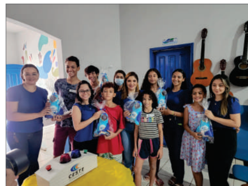
CESTE E CRAS unem forças para conscientizar crianças sobre o Dia Mundial da Água

O Dia Mundial da Água foi celebrado com a realização de uma palestra para as crianças do Serviço de Convivência e Fortalecimento de Vínculos (SCFV), em parceria com o Centro de Referência de Assistência Social (CRAS) de Estreito. Durante a ocasião, uma dinâmica de quiz foi realizada para reforçar a importância da água para os seres vivos. A equipe que se destacou nas respostas foi premiada com uma pelúcia da mascote do CESTE, Arauê.