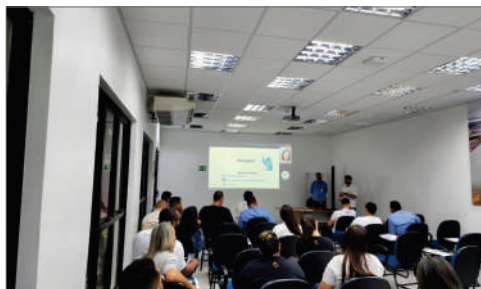
Abertura da Academia da Qualidade 2023

Assumimos a responsabilidade de adotar hábitos mais sustentáveis, e conseqüentemente, minimizar os impactos negativos diante dos recursos naturais. Mas também, nos preocupamos com a saúde e segurança das pessoas ao nosso redor.