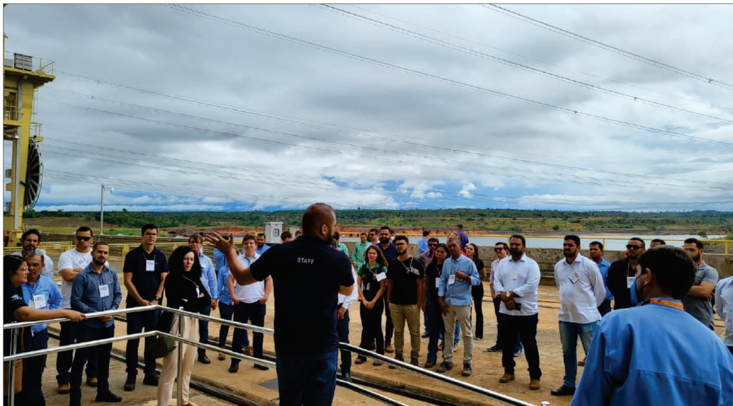
CESTE se dedica à evolução constante das tecnologias e metodologias

Promover o aperfeiçoamento contínuo dos processos com criatividade e inovação para conduzir à excelência na prestação de serviços