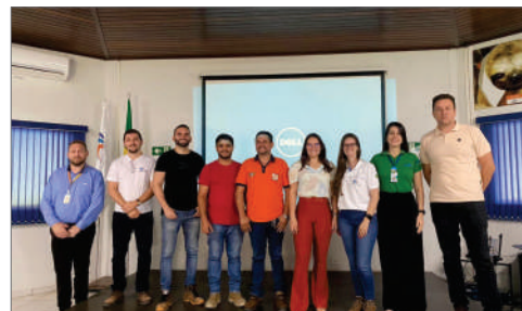
CESTE promove treinamento para Defesas Cíveis Estaduais e Municipais

para garantir a proteção das comunidades em seu entorno.