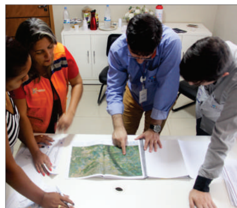
Colaboradores do CESTE comprometidos com a excelência na prestação de serviços

tais para a busca de excelência nos processos, visando sempre melhorias e aperfeiçoamentos. Com isso, o consórcio reforça seu compromisso com a qualidade na prestação de serviços, proporcionando satisfação e confiança.