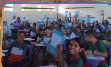
Pag. 03 - Ações de Educação Ambiental