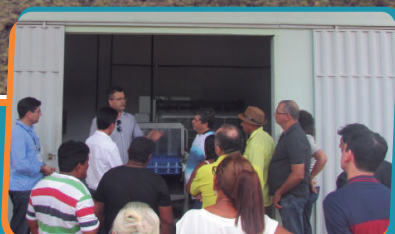
Pag. 02 - Inauguração do CBP