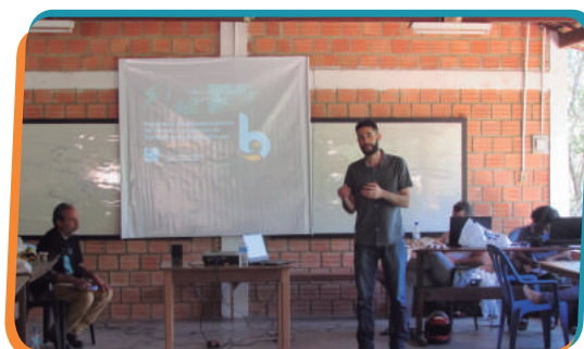
Apresentação dos resultados sobre Ictiofauna