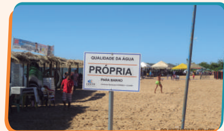
Praias próprias para banho, qualidade para a população