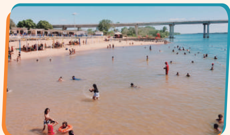
Turistas e moradores aproveitam a Temporada de Praias

Somente esse ano, o CESTE já repassou a quantia de R$ 200.000,00 às Prefeituras Municipais e Associações de Barraqueiros para execução da Temporada de Praias 2018. Com o sol quente e o belo Rio Tocantins, o aumento de turistas é expressivo, o que é de grande importância para a região, contribuindo para geração de renda e empregos! Em atendimento ao Programa de Monitoramento da Qualidade das Águas, é realizado o acompanhamento da balneabilidade, que abrange as sete praias permanentes implantadas pelo CESTE, além da Ilha Cabral. O monitoramento acontece semanalmente durante o período de praia, de 10 de junho a 20 de agosto e seus resultados são disponibilizados no site da UHE Estreito: http://uhe-estreito.com.br/meio-ambiente/monitoramento-ambiental/balneabilidade/2018.html