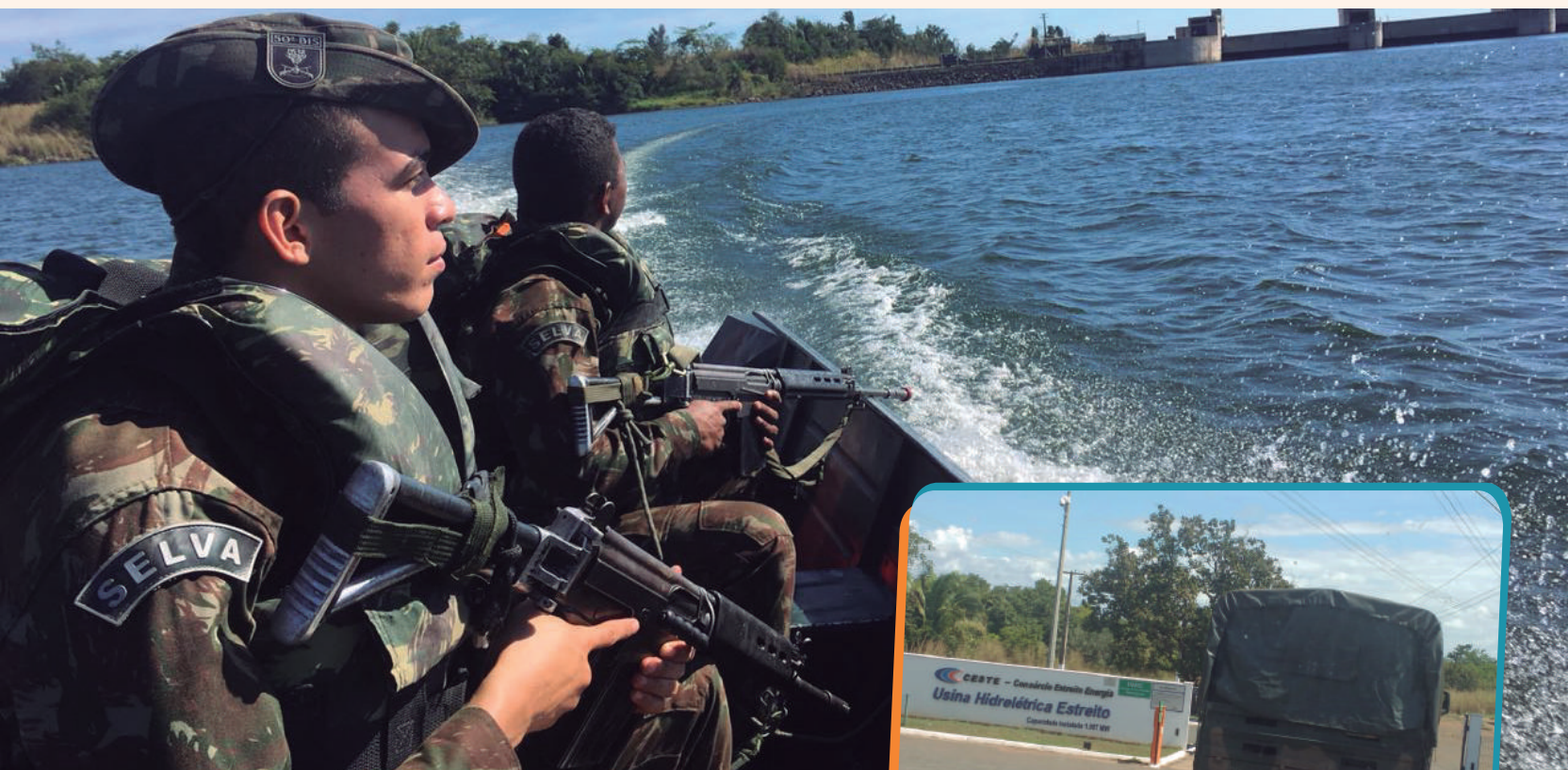
Operação no Rio Tocantins

Operações de Garantia da Lei e da Ordem permitiu várias possibilidades de preparo da tropa, buscando ampliar a capacidade de resguardar as estruturas estratégicas acima mencionadas, relevantes na área de responsabilidade da Brigada. Esse tipo de operação demonstra a capacidade de prontidão e coesão das tropas da 23ª Bda Inf SI, focadas na defesa da Pátria e na proteção da Amazônia.