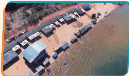
Infraestrutura para o melhor atendimento ao público