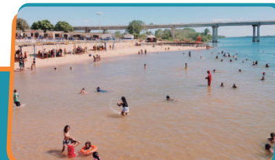
Pag. 04 - Início da Temporada de Praias 2018