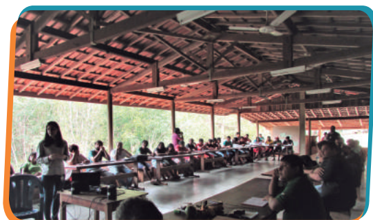
Povos indígenas e equipes do CESTE

Em abril, o CESTE participou da Reunião Anual do Conselho Gestor do PBA Timbira (PBA 39) da UHE Estreito, na sede da agência implementadora PEMPXÁ , com o objetivo de mostrar os resultados dos Monitoramentos da Qualidade das Águas (PBA 09), Fauna (PBA 13) e Ictiofauna (PBA 14). A reunião contou com a presença dos povos indígenas Kraolândia , Krikati , Gavião representados pela agência implementadora Wyty Cate e o povo Apinajé representado pela agência PEMPXÁ , além de representantes da FUNAI de Brasília, Tocantinópolis e Imperatriz. O momento foi de grande troca de informações enriquecedoras para todos os participantes.