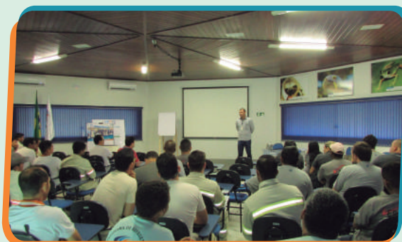
Parada Geral de Segurança da UHE Estreito