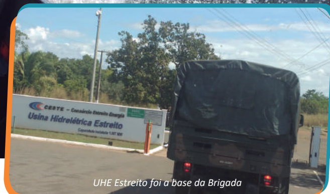
UHE Estreito foi a base da Brigada