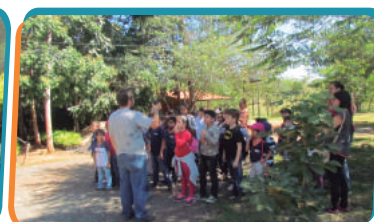
Colaboradores envolvidos na revitalização dos jardins da usina