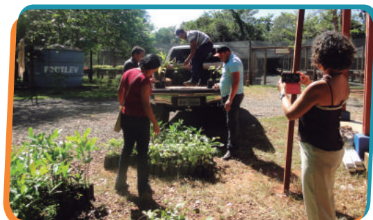
Mudas produzidas no “Berço da Natureza”

A Escola Municipal Luzia Machado Feitosa , em Goiatins/TO, está passando por uma transformação verde através do “ Projeto Plante Vida ”! O CESTE colaborou com essa importante iniciativa doando itens necessários para o plantio e cultivo das hortas, além de 100 mudas de espécies nativas do cerrado, produzidas no seu próprio viveiro, o “Berço da Natureza”, localizado na UHE Estreito. O CESTE tem orgulho em participar de ações que contribuam para a preservação do Meio Ambiente!