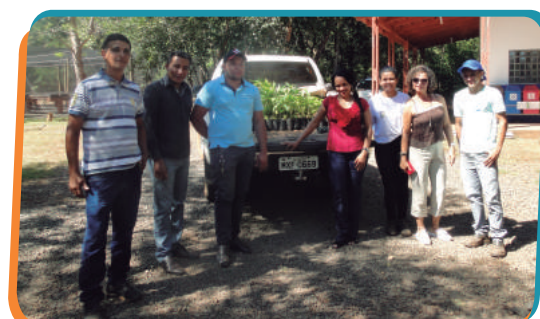
Parcerias em prol da Natureza