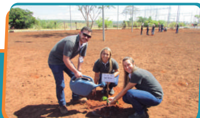
Pag. 03 - Semana do Meio Ambiente UHE Estreito